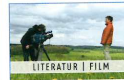
LITERATUR | FILM